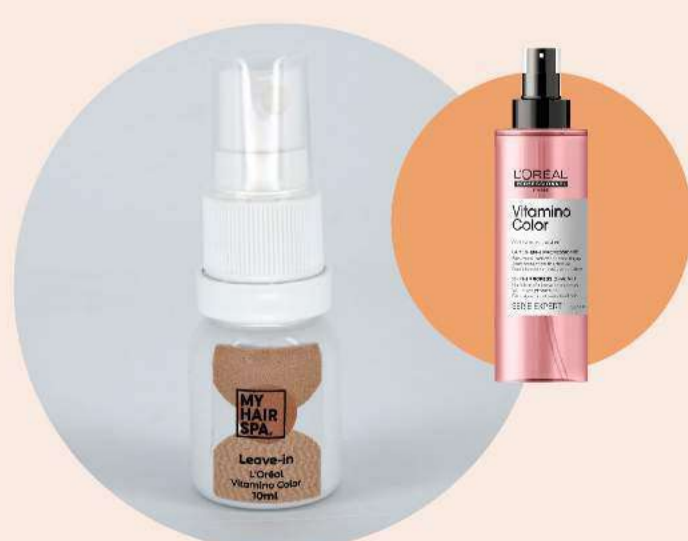
Leave-in com protetor térmico: L'Oréal Professionnel Vitamino Color 10 in-1 - 10ml