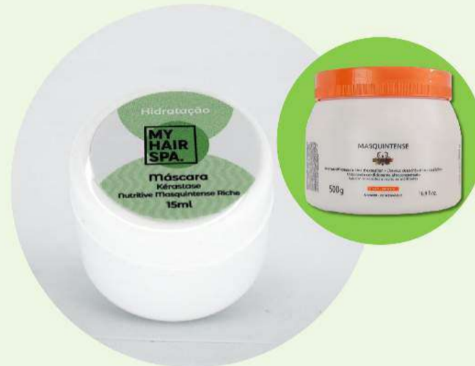
Máscara: Kérastase Masquintense - 15ml