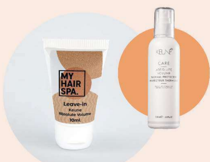
Leave-in com protetor térmico: Keune Absolute Volume - 10ml