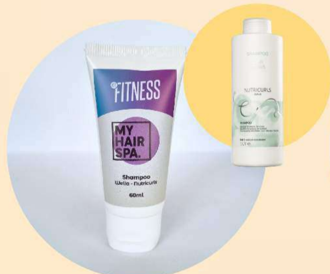
Shampoo: Wella Professionals Nutricurls - 60ml

Proporciona fios definidos, muito saudáveis, cheios de movimento e maciez.