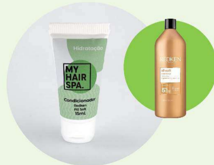
Condicionador: Redken All Soft - 15ml