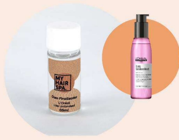
Óleo finalizador: L'Oréal Professionnel Expert Liss Unlimited - 5ml