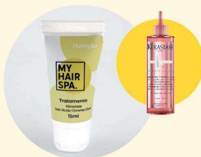
Tratamento com enxágue: Kérastase Soin Acide Chroma Gloss - 15ml