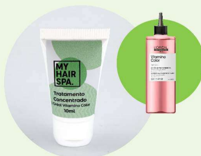
Tratamento concentrado: L'Oréal Professionnel Vitamino Color Resveratrol - 10ml