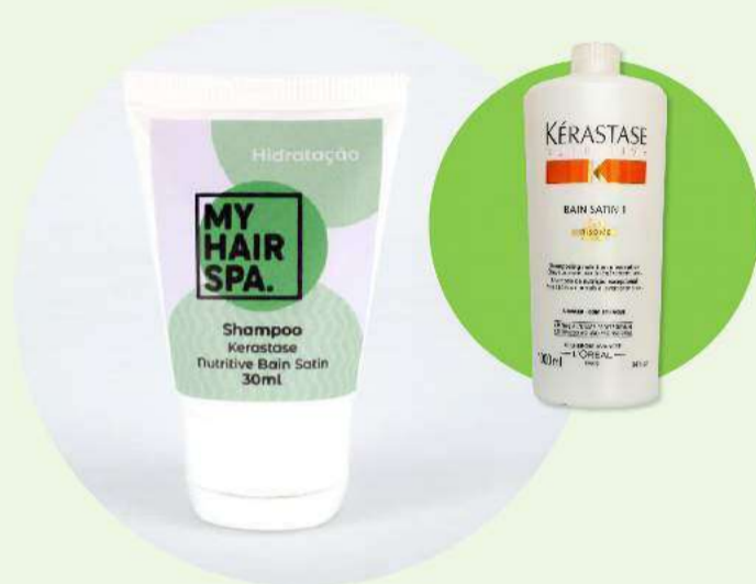
Shampoo: Kérastase Bain Satin - 30ml