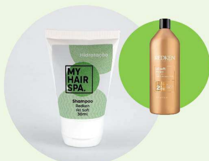
Shampoo: Redken All Soft - 30ml