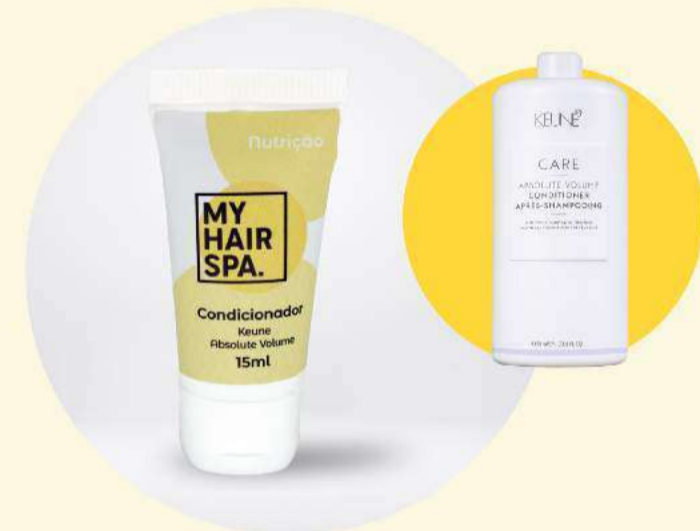
Condicionador: Keune Absolute Volume Conditioner - 15ml