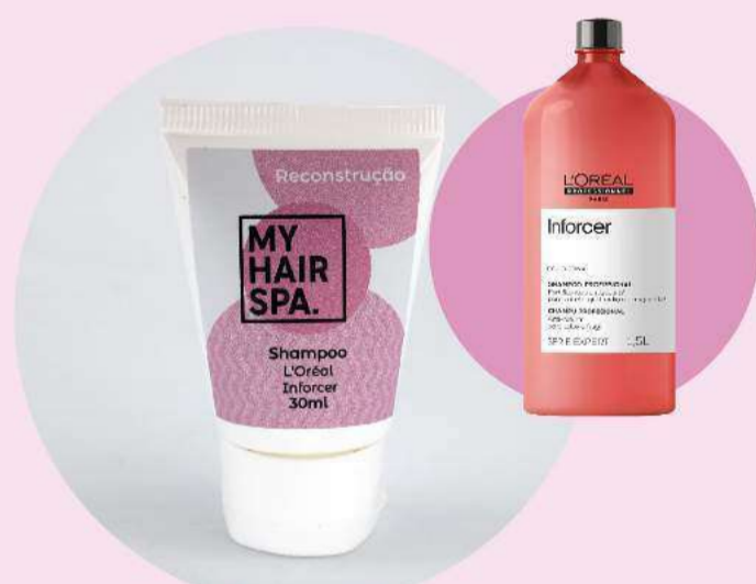
Shampoo: L'Oréal Professionnel Serie Expert Inforcer - 30ml