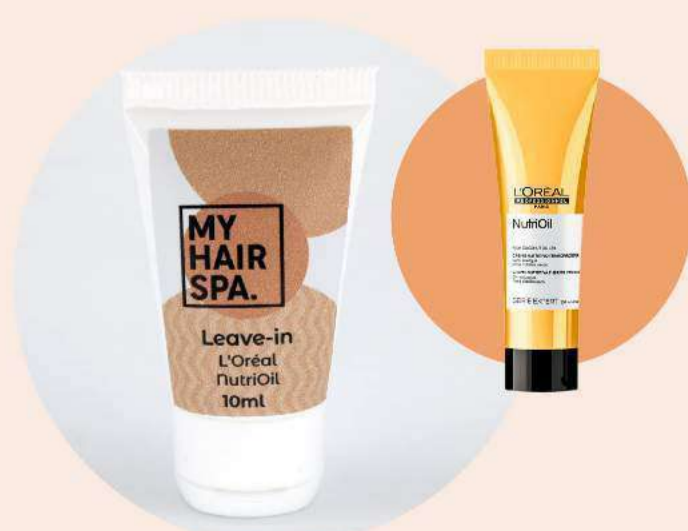
Leave-in com protetor térmico: L'Oréal Professionnel NutriOil - 10ml