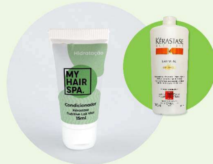
Condicionador: Kérastase Lait Vital - 15ml