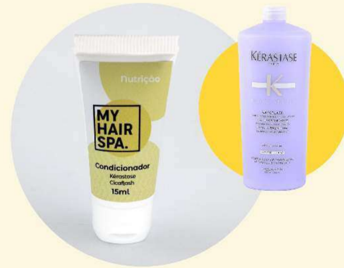
Condicionador: Kérastase Cicaflash - 15ml