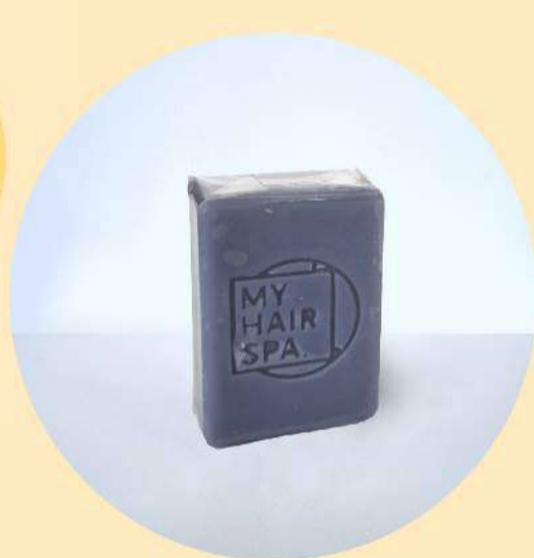
Sabonete: Artesanal - 35gr