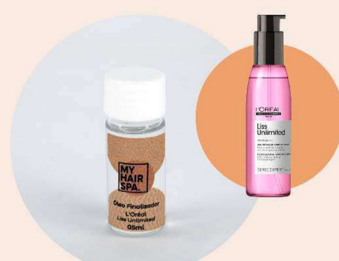
Óleo finalizador: L'Oréal Professionnel Expert Liss Unlimited - 5ml