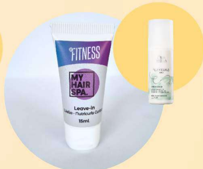
Leave-in: Wella Professionals Nutricurls - 15ml