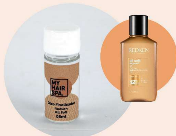
Óleo finalizador: Redken All Soft - 5ml