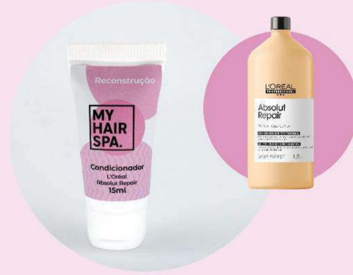
Condicionador: L'Oréal Professionnel Absolut Repair Gold Quinoa + Protein - 15ml