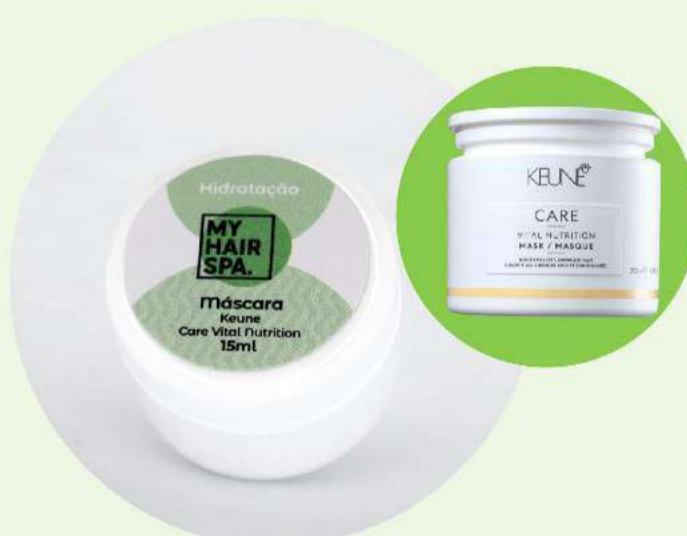
Máscara: Keune Care Vital Nutrition Mask - 15ml