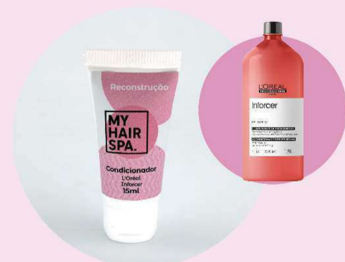
Condicionador: L'Oréal Professionnel Serie Expert Inforcer - 15ml