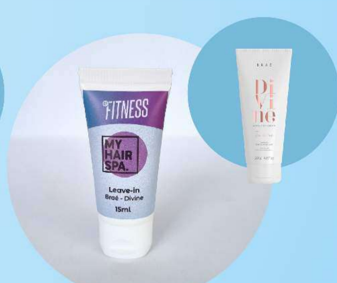
Leave-in: Braé - Divine - 15ml