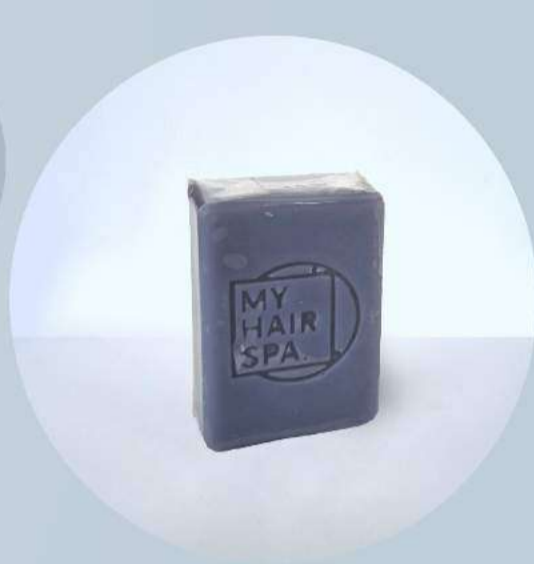
Sabonete: Artesanal - 35gr