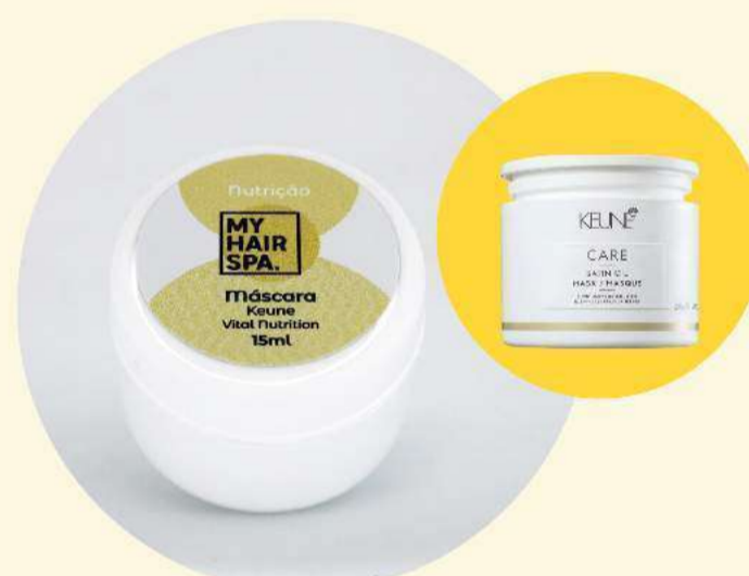
Máscara: Keune Satin Oil - 15ml