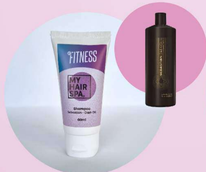
Shampoo: Sebastian Professional Dark Oil - 60ml

Nutre para suavizar e trazer maciez extrema para os fios. Indicado para todos os tipos de cabelos.