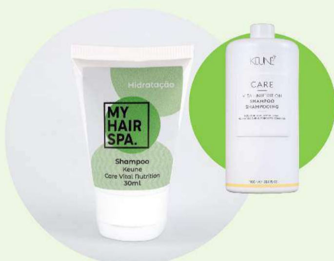
Shampoo: Keune Care Vital Nutrition - 30ml