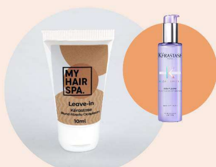
Leave-in com protetor térmico: Kérastase Cicaplasme - 10ml