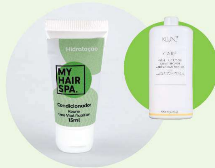
Condicionador: Keune Care Vital Nutrition - 15ml