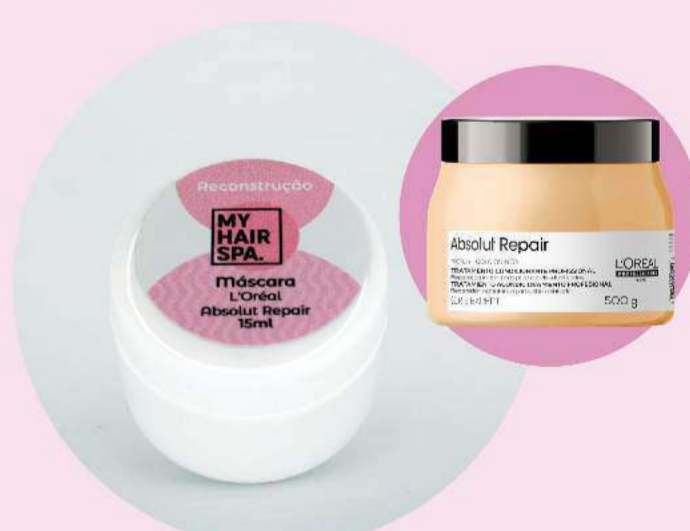
Máscara: L'Oréal Professionnel Absolut Repair Gold Quinoa + Protein - 15ml