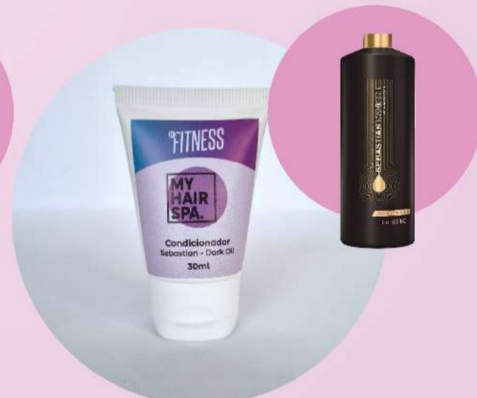
Condicionador: Sebastian Professional Dark Oil - 30ml