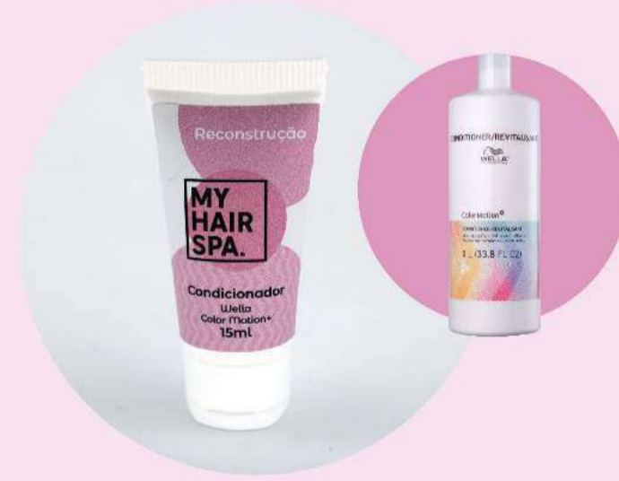
Condicionador: Wella Professionals Color Motion+ - 15ml