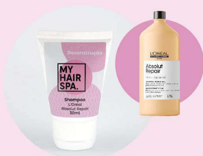
Shampoo: L'Oréal Professionnel Absolut Repair Gold Quinoa - 30ml