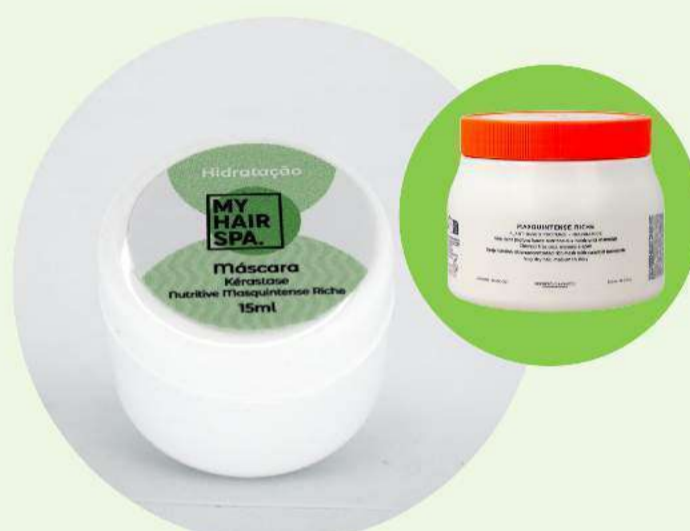
Máscara: Kérastase Masquintense Riche - 15ml