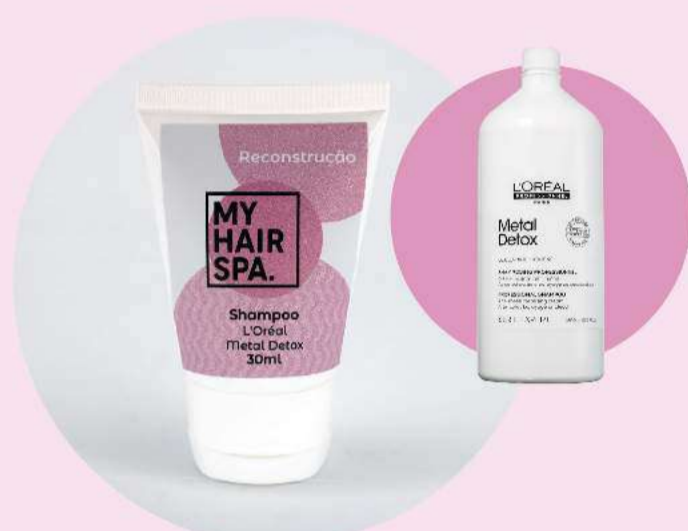
Shampoo: L'Oréal Metal Detox - 30ml