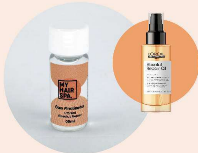
Óleo finalizador: L'Oréal Professionnel Absolut Repair Gold Quinoa + Protein - 5ml