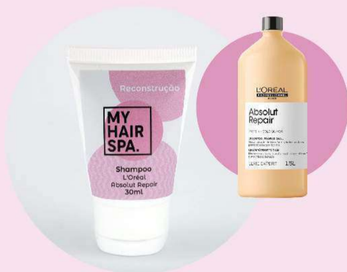
Shampoo: L'Oréal Professionnel Absolut Repair Gold Quinoa - 30ml