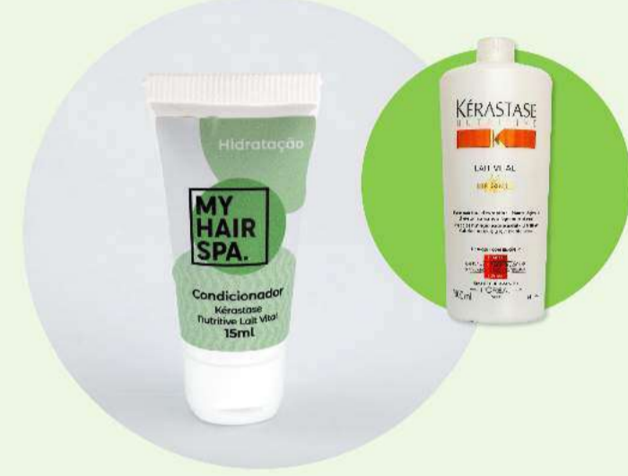
Condicionador: Kérastase Lait Vital - 15ml