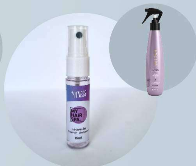
Leave-in: Aneethun - Liss System 15ml