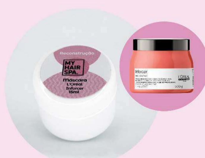
Máscara: L'Oréal Professionnel Serie Expert Inforcer - 15ml