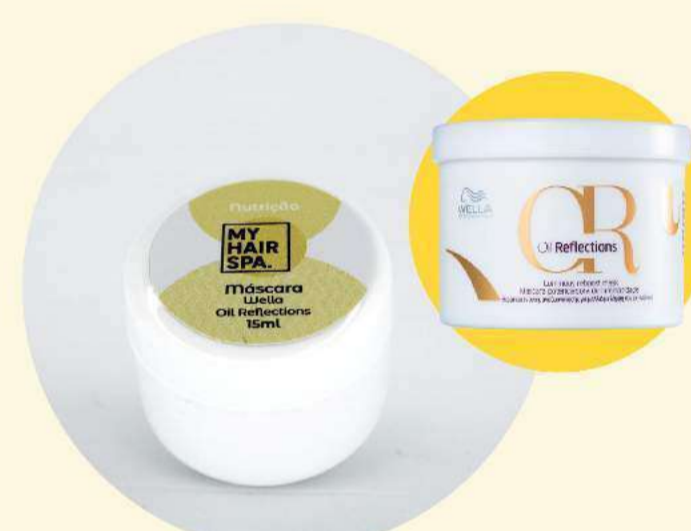
Máscara: Wella Professionals Oil Reflections Luminous Reboost - 15ml