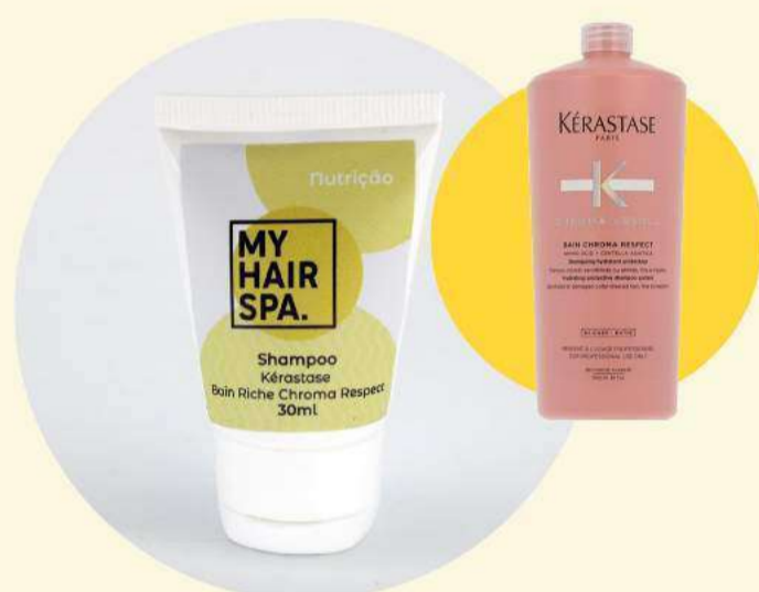
Shampoo: Kérastase Bain Riche Chroma Respect - 30ml