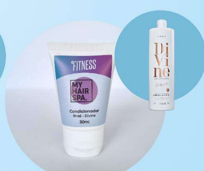
Condicionador: Braé - Divine - 30ml