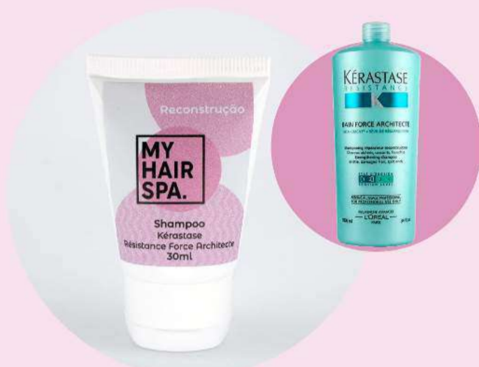
Shampoo: Kérastase Réistance Bain Force Architecte - 30ml