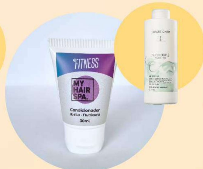
Condicionador: Wella Professionals Nutricurls - 30ml