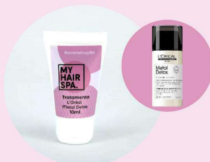
Tratamento concentrado: L'Oréal Metal Detox - 10ml