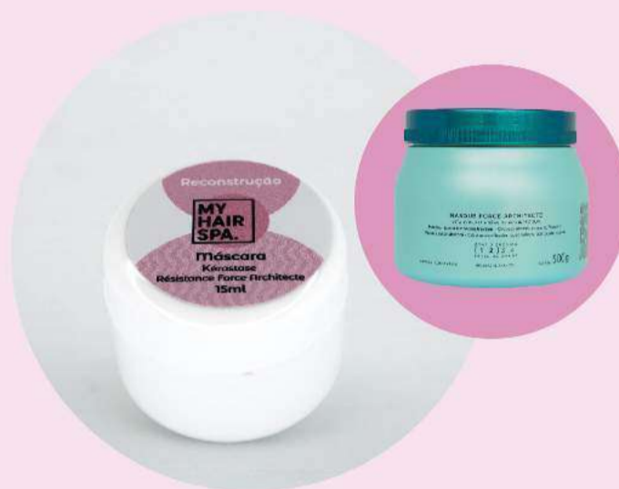
Máscara: Kérastase Masque Force Architecte - 15ml