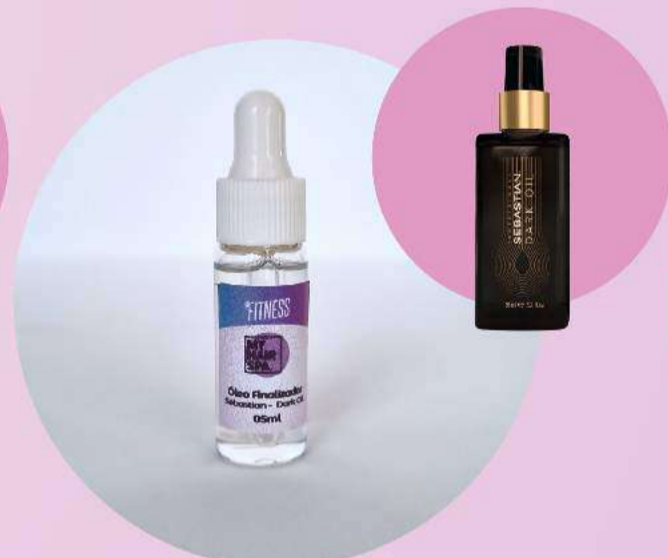
Óleo finalizador: Sebastian Professional Dark Oil - 05ml