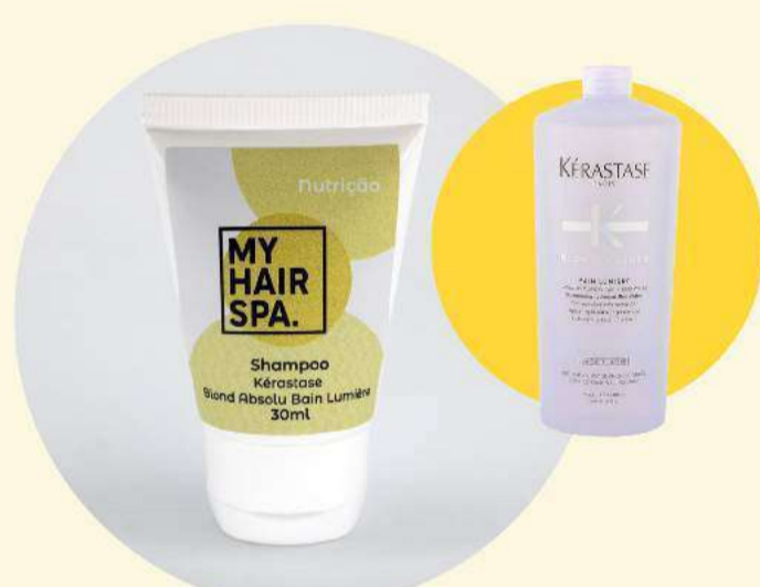
Shampoo: Kérastase Bain Lumière - 30ml