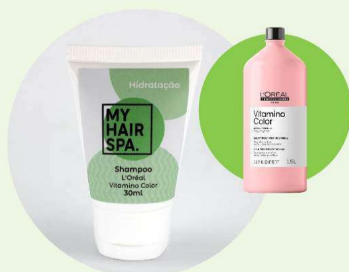
Shampoo: L'Oréal Professionnel Vitamino Color Resveratrol - 30ml