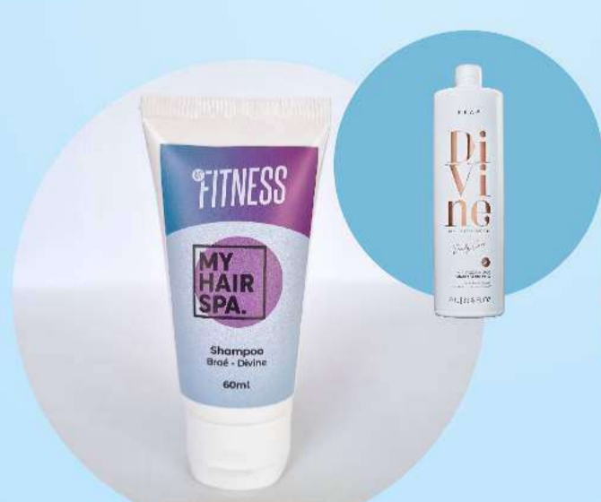
Shampoo: Braé - Divine - 60ml

Deixa os fios intensamente sedosos, nutridos e totalmente livres de frizz. Indicado para todos os tipos de cabelos.