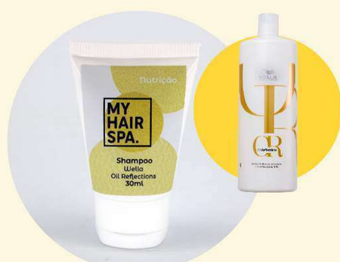
Shampoo: Wella Professionals Oil Reflections Luminous Reveal - 30ml