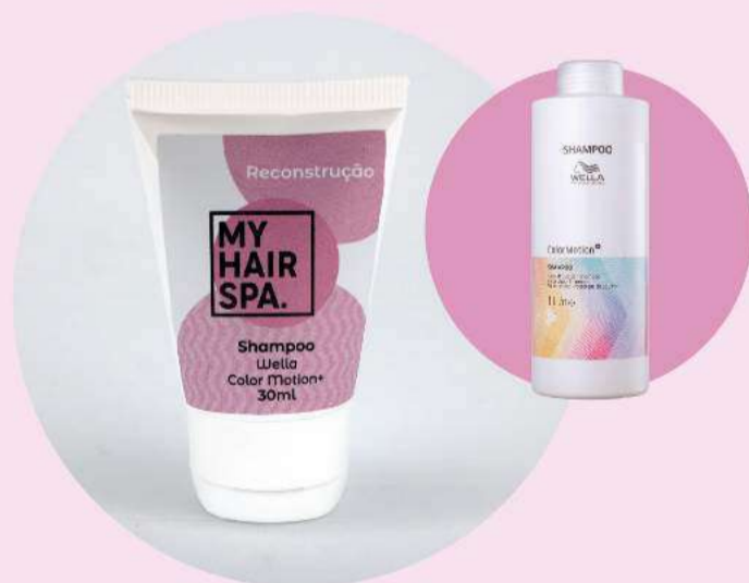
Shampoo: Wella Professionals Color Motion+ - 30ml