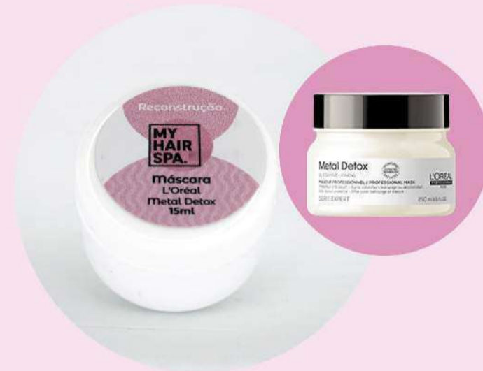
Máscara: L'Oréal Metal Detox - 15ml