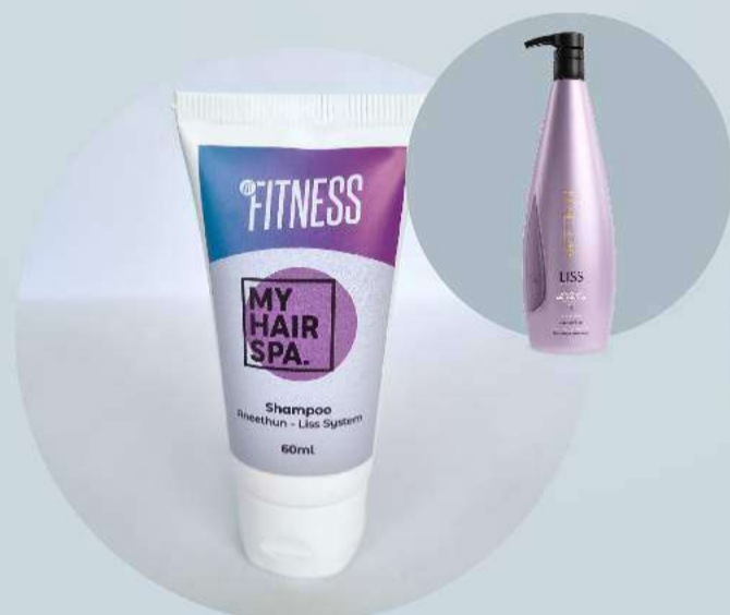
Shampoo: Aneethun - Liss System 60ml

Oferece extrema disciplina e alinhamento capilar impecável.