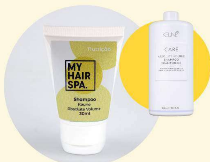
Shampoo: Keune Absolute Volume - 30ml