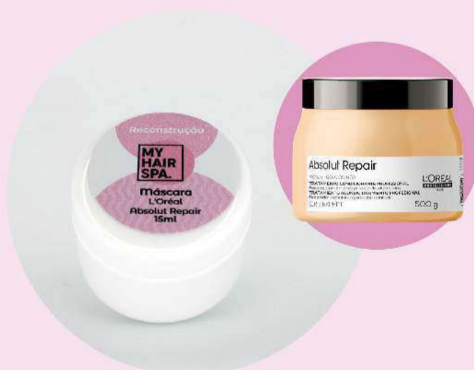
Máscara: L'Oréal Professionnel Absolut Repair Gold Quinoa + Protein - 15ml