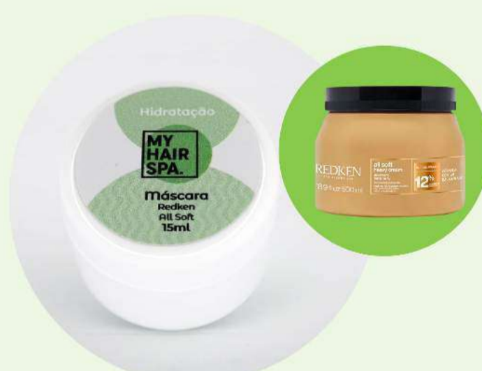
Máscara: Redken All Soft - 15ml