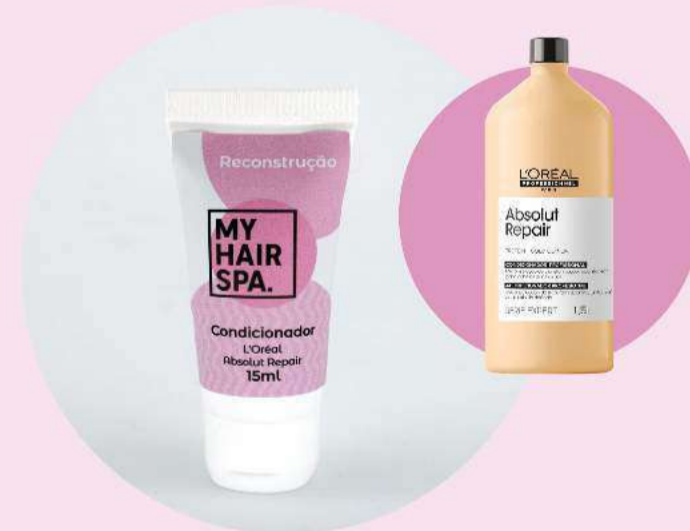
Condicionador: L'Oréal Professionnel Absolut Repair Gold Quinoa + Protein - 15ml