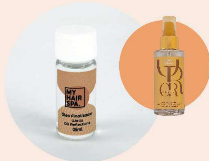
Óleo finalizador: Wella Professionals Oil Reflections Luminous Smoothing - 5ml