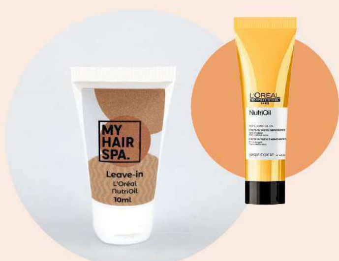
Leave-in com protetor térmico: L'Oréal Professionnel NutriOil - 10ml