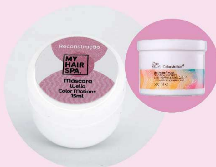
Máscara: Wella Professionals Color Motion+ - 15ml