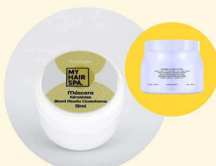
Máscara: Kérastase Cicaplasme - 15ml