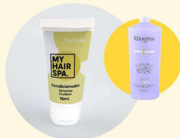
Condicionador: Kérastase Cicaflash - 15ml