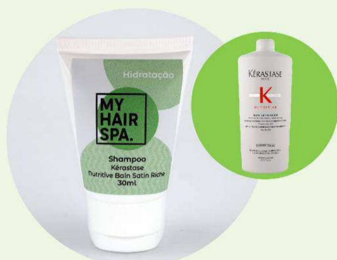
Shampoo: Kérastase Bain Satin Riche - 30ml