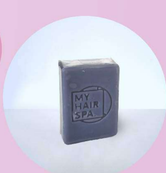
Sabonete: Artesanal - 35gr