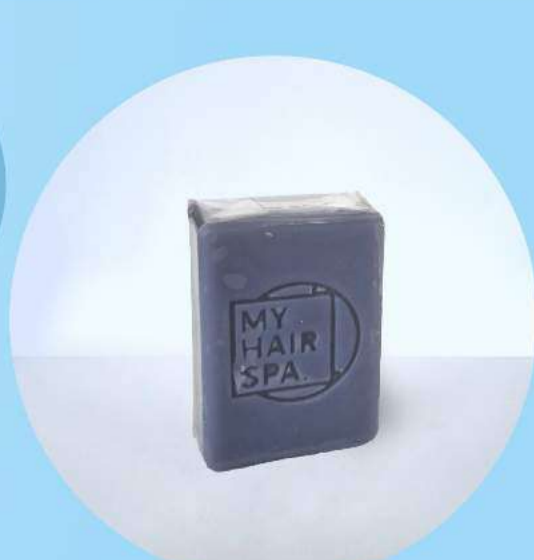
Sabonete: Artesanal - 35gr