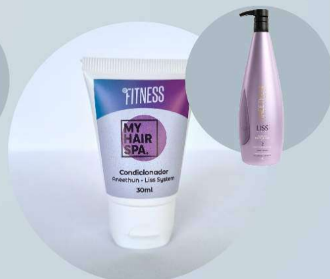
Condicionador: Aneethun - Liss System 30ml