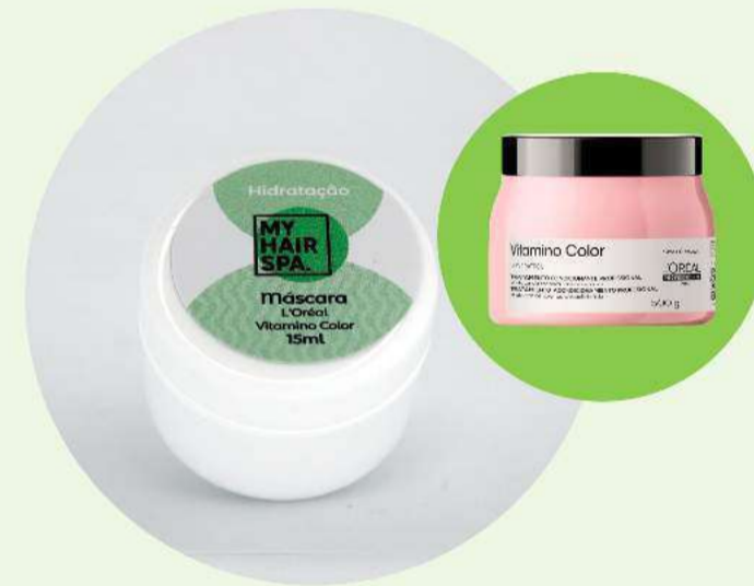
Máscara: L'Oréal Professionnel Vitamino Color Resveratrol - 15ml